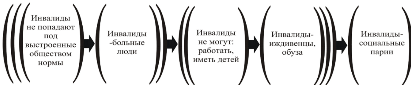
Рис. 2 [4]

Определение выражает квинтэссенцию восприятия обществом социального феномена: