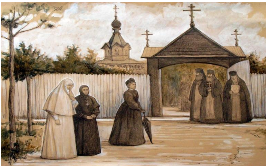
Рисунок 3. А. И. Игнатова, 2011 г. Великая княгиня Елизавета Фёдоровна и игуменья Ювеналия во время посещения Сергиева скита.

20 октября в 5 часов утра Елизавета Фёдоровна отправилась на лошадях в Тихонову пустынь, где с 6 часов утра присутствовала на раннем утреннем богослужении, затем были совершены молебен и панихида. После чего она посетила святой источник обители и дуб, в котором проводил земную жизнь Тихон, Калужский чудотворец. Испулавшись в дамской купели источника, Великая княгиня вернулась в Тихонову пустынь 1 , где внимательно осмотрела всю территорию обители вместе с настоятелем архимандритом Лаврентием. Затем, возвратившись в Сергиев скит и отстояв полностью вечернее богослужение, ЕИВ ВК отправилась на лошадях к разъезду № 19 Брянской железной дороги, откуда на поезде № 10 выехала на Москву, прибыв на следующий день в 8 часов 20 минут утра и сразу же отправившись в Марфо-Мариинскую обитель 2 [11, с. 60 – 63; 5, с. 167 – 168].