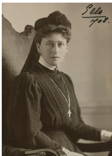
Рисунок 1. Великая княгиня Елизавета Фёдоровна в трауре по мужу. Фото 1908 г.

6 и 7 февраля продолжали служить панихиды по убиенному князю. На всех панихидах присутствовала его вдова ЕИВ ВК Елизавета Фёдоровна, не отходившая от гроба своего покойного супруга. Как упоминается уже в другом номере «Правительственного Вестника», к 8 февраля на похороны и отпевание прибыли представители из разных губерний Российской империи, в том числе из Калуги прибыла депутация местного гарнизона для возложения венка на гроб почившего Великого князя Сергея Александровича [13, с. 3].