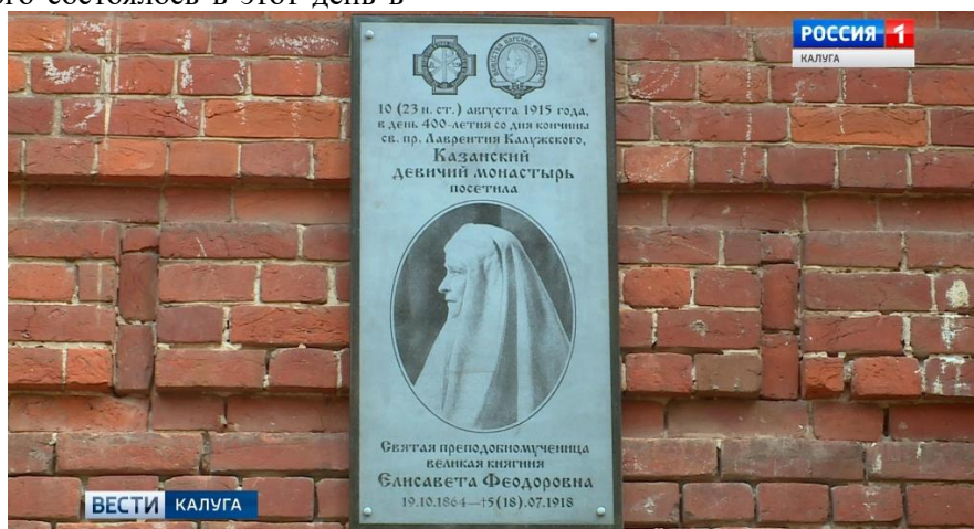
Рисунок 6. Мемориальная доска в Казанском девичьем монастыре, посвященная Великой княгине Елизавете Фёдоровне в честь её пребывания на Калужской земле 10 августа 1915 г.

Великая княгиня посчитала своим долгом лично посмотреть условия размещения монастырей, которые были эвакуированы в Калугу в связи с военными действиями и захватом неприятелем ряда западных территорий России. При посещении Туровицкого монастыря Холмской епархии, который размещался в духовном училище (ныне там находятся женское духовное училище и Православная гимназия; современный адрес: г. Калуга, ул. Дарвина 13/33), Её Высочество беседовала с игуменьей этого монастыря Магдалиной, а затем посетила Радочницкий монастырь (также принадлежал Холмской епархии), разместившийся в здании семинарии. В Казанском девичьем монастыре Елизавета Фёдоровна была встречена священником Иоанном Протопоповым и игуменьей Ангиной (Яновской). Её Высочество осмотрела монастырь, беседовала с настоятельницей в её покоях [6, с. 117 – 121].