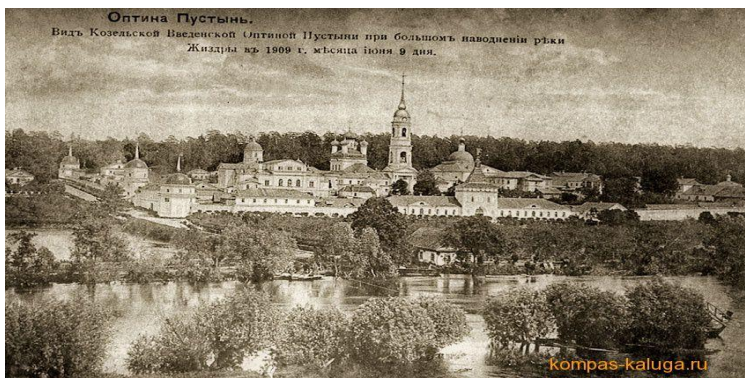
Рисунок 4. Оптина пустынь в 1909 г.