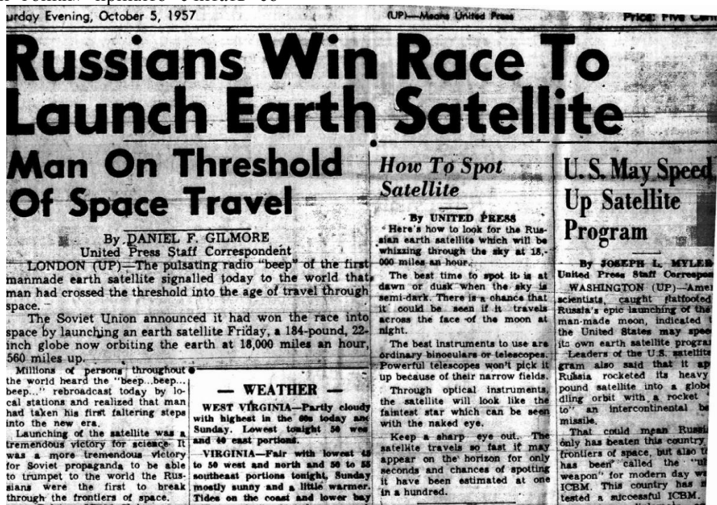
Рисунок 1 – Газета «United Press», выпуск октября 1957 г.

Произошедшее в конце 1950-х гг. эпохальное событие – стартовала космическая эра человечества – ввергло в шок весь мир. Однако, в мире запуск «Спутника-1» восприняли неоднозначно. В СССР он произвёл небывалый подъём гордости за свою страну, в США же представлялся как сильный удар по престижу государства. Приведем отрывок из публикации «United Press», октябрь 1957 г.: «Запуск спутника был огромной победой науки, но ещё более грандиозной победой советской пропаганды было то, что она смогла вострубить всему миру о том, что русские первые преодолели границы космоса» (Рисунок 1). США, которые до этого считались лидером в деле космонавтики, отстали от СССР. Однако мирным это событие назвать нельзя. Соперничая друг с другом, две сверхдержавы боролись за научное первенство в новой неизведанной сфере. Запуск «Спутника-1» дал старт противостоянию Америки и СССР, затронувшему военную, научную, экономическую, политическую и информационную сферы.