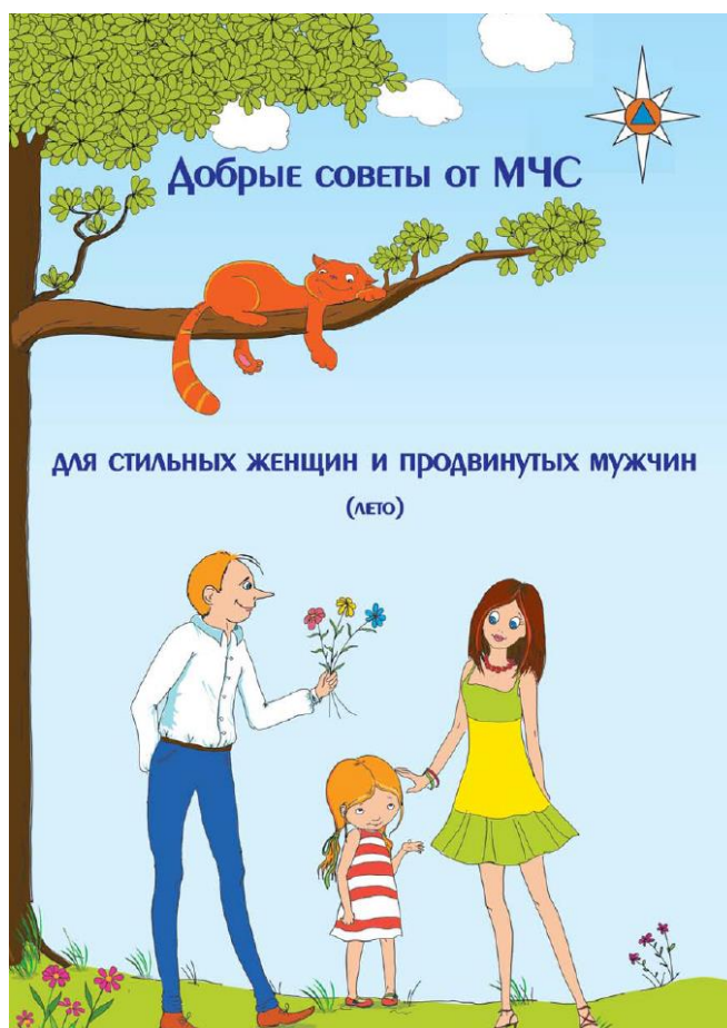
Одна из памяток МЧС, представленных на выставке