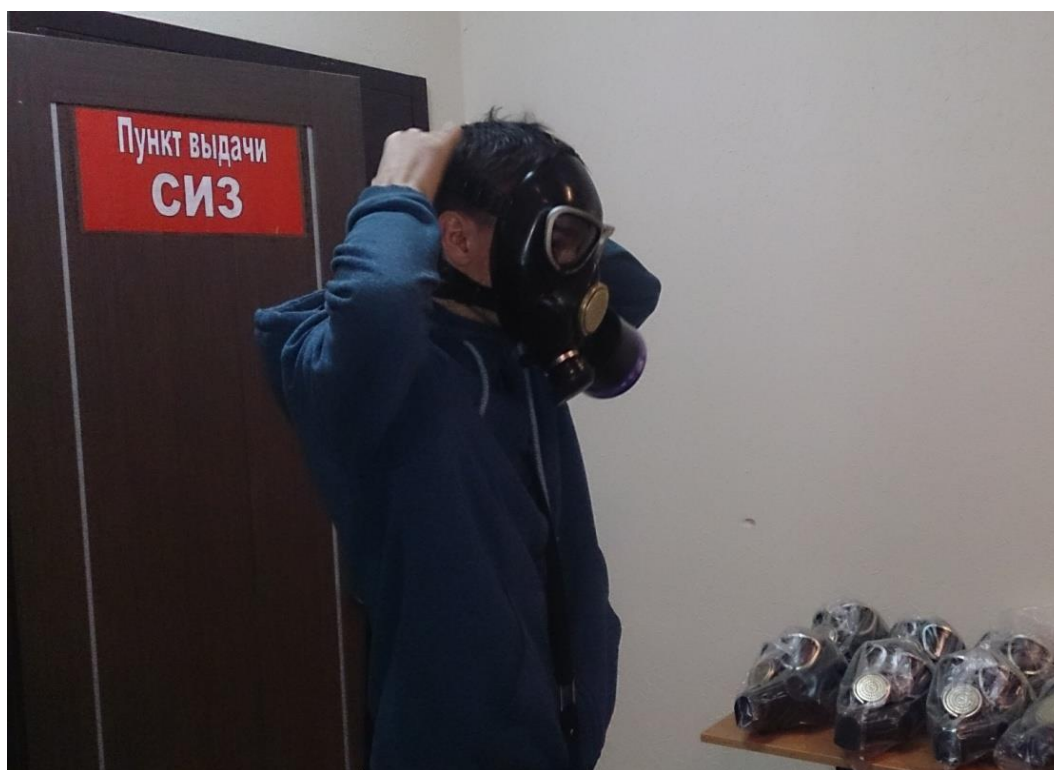
Практическое развертывание пункта выдачи средств индивидуальной защиты

В течение месяца в читальном зале библиотеки корпуса по адресу: ул. Степана Разина, 22/48, пом.1 можно ознакомиться с выставкой учебно-методической литературы по безопасности жизнедеятельности и гражданской обороне, а также фотовыставкой «2018 – Год культуры безопасности», на которой представлены памятки по вопросам безопасности и добрые советы МЧС для стильных женщин и продвинутых мужчин.