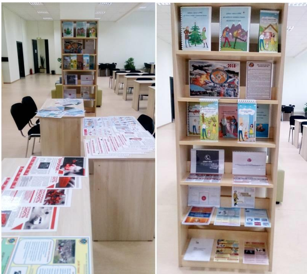
Фотовыставка «2018 – Год культуры безопасности»