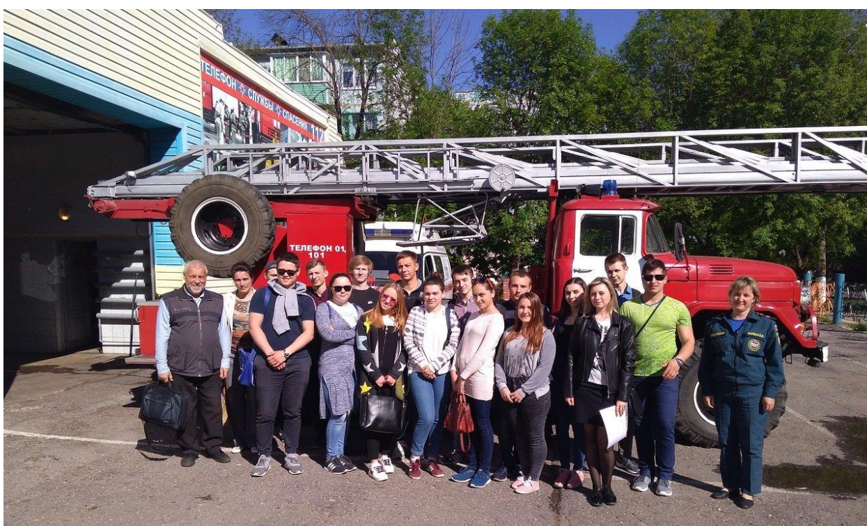
Экскурсия студентов Института естествознания в Пожарную часть г. Калуги

В ходе Месячника Главное управление МЧС России по Калужской области проводит «Дни открытых дверей» с доведением информации об истории создания, становления и деятельности Единой государственной системы предупреждения и ликвидации чрезвычайных ситуаций на современном этапе, показом имеющейся техники, средств спасения и практическим показом действий в чрезвычайных ситуациях. За информацией о возможности посетить данную экскурсию обращаться в отдел ГОЧС и ОТ (Учебный корпус № 1, каб. 516).